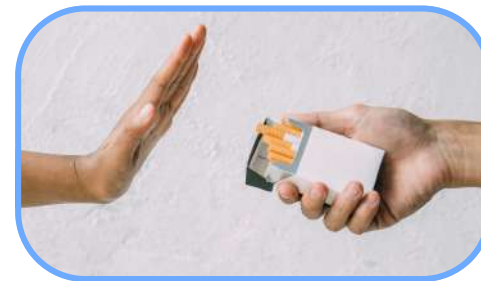
Mois sans tabac