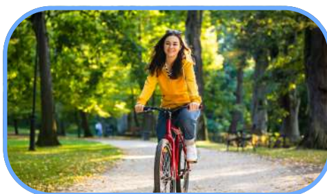
Semaine de la mobilité